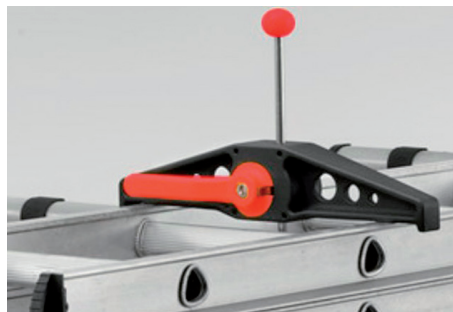
Paso 2: Cierre con llave