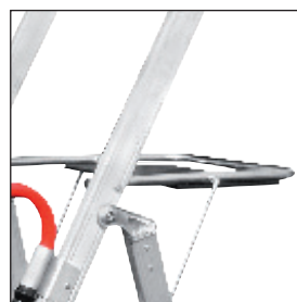
Bandeja capacidad 25 kg