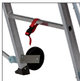
Ruedas y correa anti separación