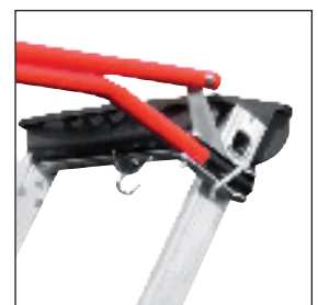
Gancho y bandeja portaherramientas