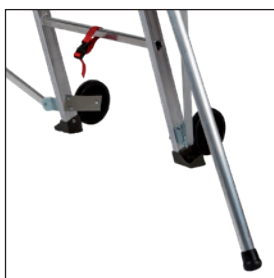
Estabilizadores incluidos en Art. N° 0962 975 095*