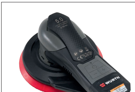
Regulación con 4 velocidades