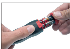
Tirar del tapón para extraer el depósito.