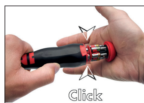
Cierre seguro del depósito por sistema clip.