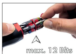
Fácil extracción de la punta deseada.