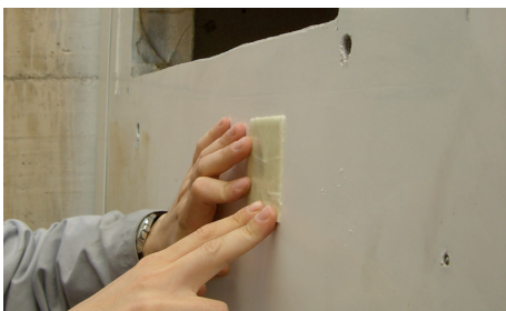
Reparación de una fisura en un panel de fibra