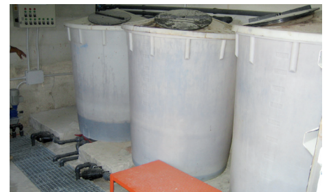
Reparación de una fisura en un depósito de líquidos