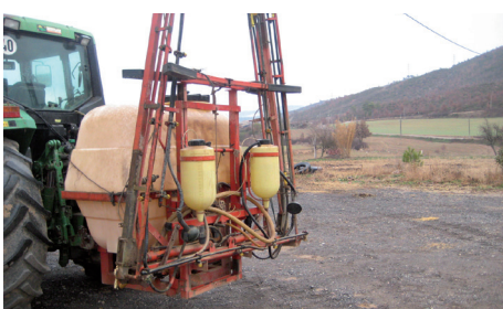
Reparación de una fisura en un tanque de líquidos