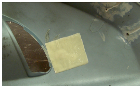
Reparación de una fisura en un spoiler