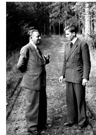
Prof. Dr. h. c. mult. Reinhold Würth, Presidente del Consejo de Administración de la Fundación del Grupo Würth, Presidente honorario del Consejo Asesor del Grupo Würth